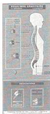
Affiche "MAIL 14" Exemple de document pédagogique pour Praticien d'École du Dos de KINÉ