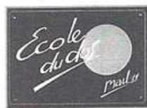
Plaque Professionnelle pour École du Dos "MAIL 14"